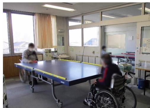
共有スペースを利用した卓球

活動内容は卓球、ゲートボール、カローリング（カーリングを通常の床で行うもの）、フライングディスクなど様々です。ご利用者様の障がいの程度に合わせて道具やルールを検討しながら行っています。ご利用者様からは「普段のリハビリでは、すばやく体を動かすことがないから気持ちいい。やっていくうちに体が動かせるようになっていく。」「得意なものが見つかる楽しい。」などの声が聞かれました。通常のリハビリでは規則的な動きを繰り返すことが多いですが、ゲーム形式で行うと不規則な動きや瞬発力が求められます。レクスポの活動を通して、そういった動きがよい刺激になっているのだと支援者の私自身気づくことができました。勝負事で熱くなれるのもレクスポのよいところだと思います。