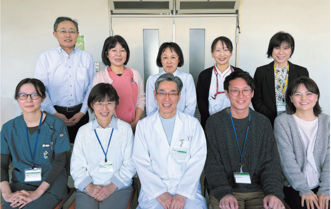
写真：高次脳機能障害支援スタッフ