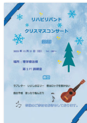
▲利用者さまに制作していただいたポスターの一部