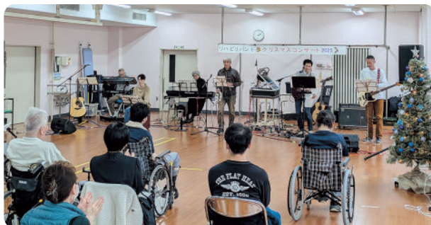
▲クリスマスコンサートの様子